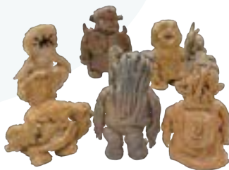
「怪獣アベンジャーズ」 岡本 直樹