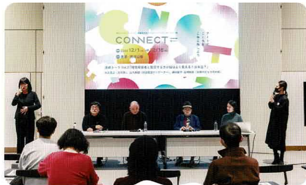
画像: 昨年度の開催風景