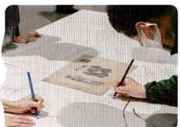
画像: 昨年度の開催風景

文字や絵を「かく」ことでアート鑑賞。聞こえる人・聞こえない人・聞こえにくい人が一緒に楽しめます。