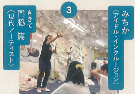
写真:みちか個展 あしたもがんばれます。