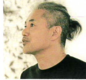
林 真理子 [審査委員長] Mariko Hayashi 作家