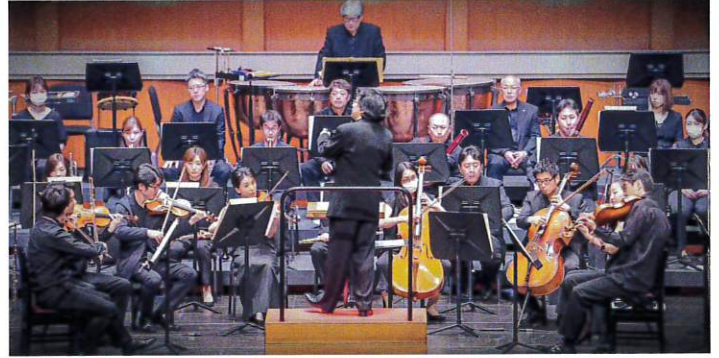
近江シンフォニエッタ