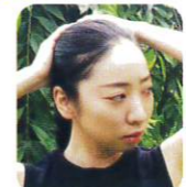
森山真由子 (ダンサー)