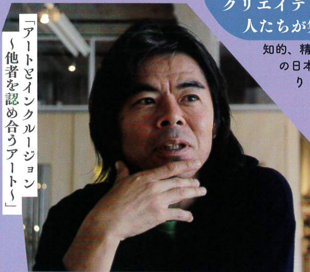
「アーティストとインクルージョン」 「他者を認め合うアート」

クリエイティブサポートレッツでは、障害者と言われる人たちが集まって、生活したり、活動したりしています。