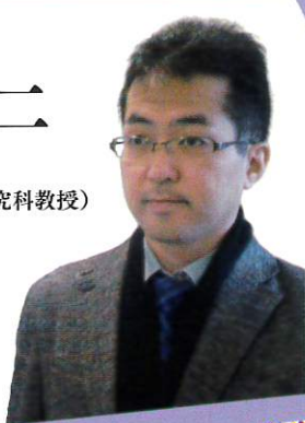
「学びとは何か? / 障害者の学び“から” 私たちの学び“へ”

このカンファレンスでは、このようなことを実践し、普通の人より少し詳しい人たちが集まって話し合います。お越しいただくみなさんも含めて、この出会いがどんな “学び” を生むのか、楽しみにしています。