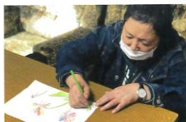
就労継続支援B型・生活介護事業所

「笑顔と元気」が合言葉。作業を中心に、自立と社会生活を共に考えます。現在27名在籍。