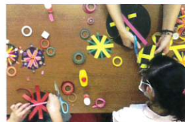
放課後等デイサービス

安心でおいしいクッキー、ケーキが自慢。喫茶や清掃業務も。44名の方が活動しています。