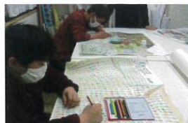
就労継続支援B型事業所

にぎやか会の第一事業として、平成9年4月開設。現在、46名の方が利用されています。