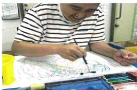
就労継続支援B型・生活介護事業所