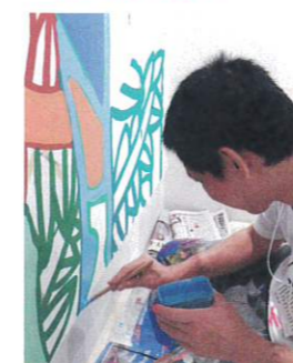
rooms / ライフペインティング