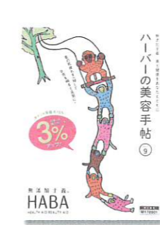
(株)ハーバー研究所 / 美容手帖