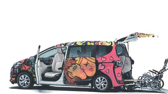
トヨタ自動車(株) / 福祉車両ラッピングカー