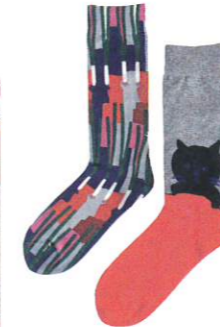
タビオ(株) / 靴下