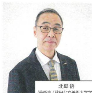
北郷 悟 (美術家 / 秋田公立美術大学学長)