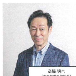
高橋 明也 (東京都美術館館長)