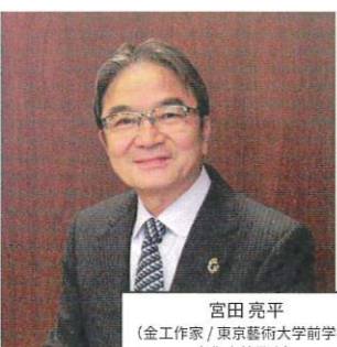
宮田 亮平 (金工作家 / 東京藝術大学前学長 / 文化庁前長官)