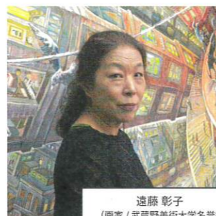
遠藤 彰子 (画家 / 武蔵野美術大学名誉教授)