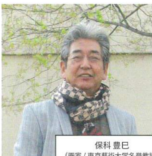
保科 豊巳 (画家 / 東京藝術大学名誉教授)