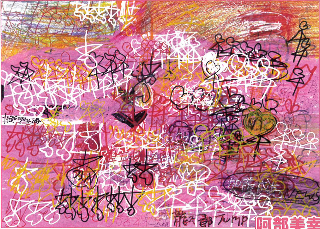
《チューリップと相合傘》2011年、380×540 mm

公立美術館における障害者等による文化芸術活動を促進させるためのコア人材の コミュニティ形成を軸とした基盤づくり事業「ハイロケット事業」 (文化庁委託事業 令和5年度障害者等による文化芸術活動推進事業)