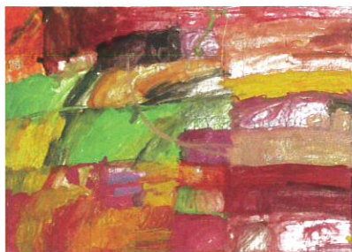
《チューリップと相合傘》2010年、380×540 mm