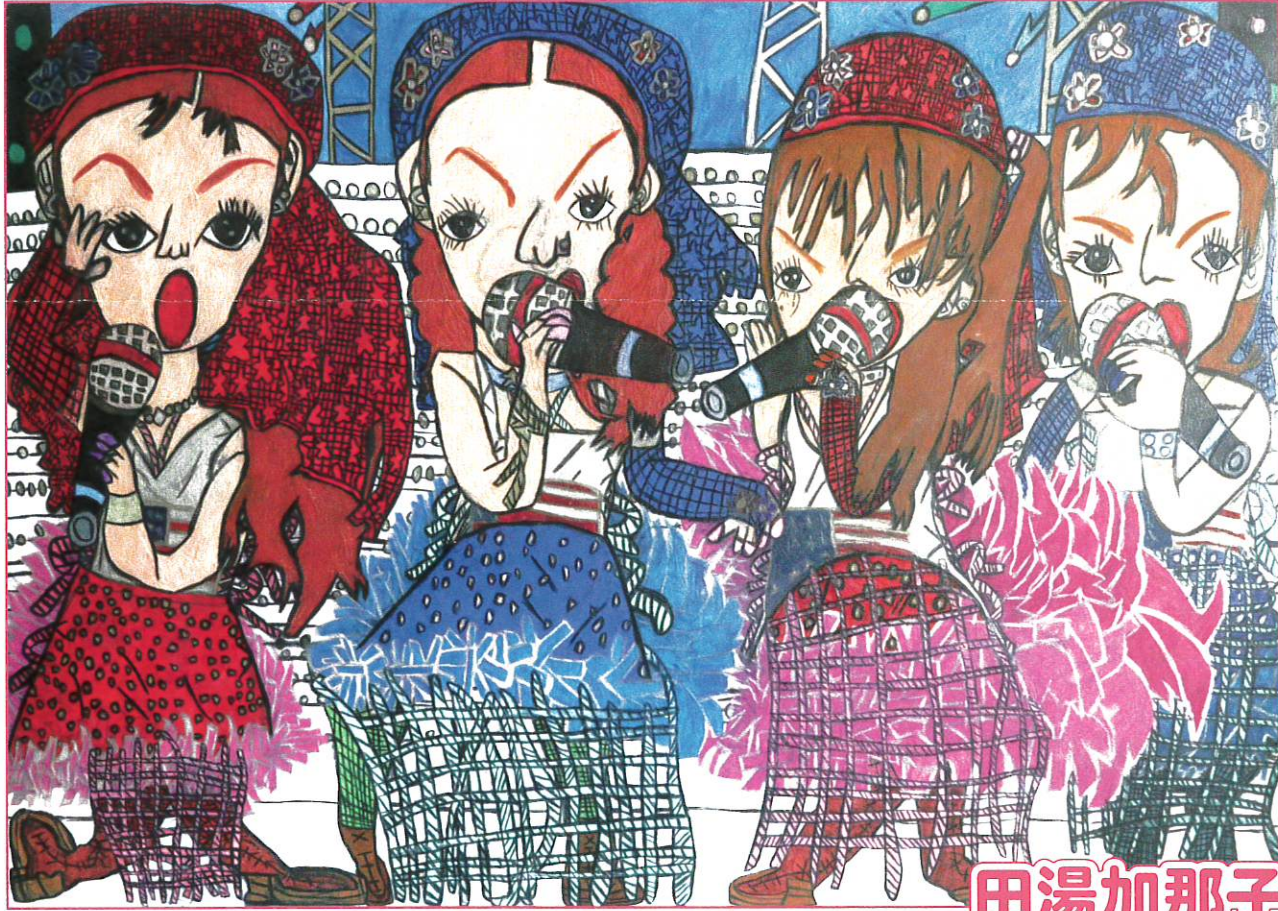
タイトル不明 2001年、515×728 mm