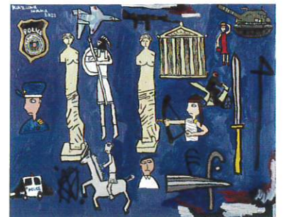
「二人のヴィーナス」岩間 一真