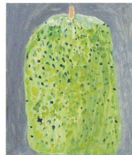
「鎮座する冬瓜」藤本 湊也