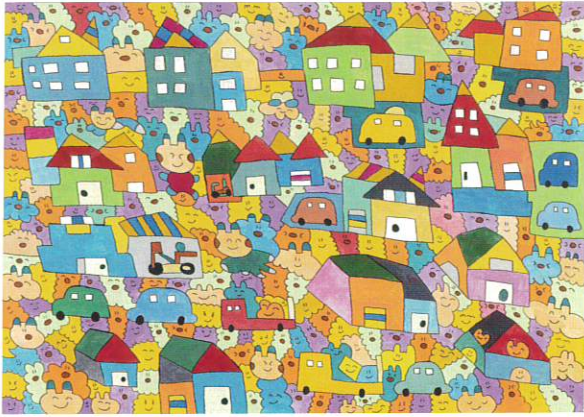
「家をどうぶつえんで車でドライブしてうさぎちゃんとくまちゃんたちたんけんしよう」野本 晃弘