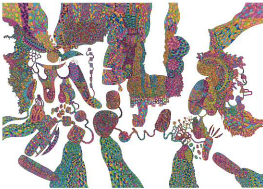
「走馬灯・解体回転木馬」山口 かずなり