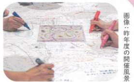
画像：昨年度の開催風景

作品を見て感じた印象や浮かんだ疑問を、文字や絵をかきながら交流し、鑑賞を深めてみませんか。手話通訳と文字通訳があります。