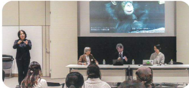
画像：昨年度の開催風景