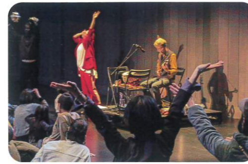
画像：昨年度の開催風景

鑑賞マナーのない、ダンスパフォーマンス。若手ミュージシャンによる柔らかな音楽とともに、一緒に踊っても、出たり入ったりしながら鑑賞してもOK。最後には感想を共有する時間も設けます。