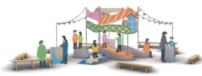
画像：会場イメージ

3日～9日)を含む17日間、展示やワークショップ、トークなど、さまざまなプログラムを展開します。のびのびと心を開放して、「わたし」の世界が広がるような体験をお楽しみください。