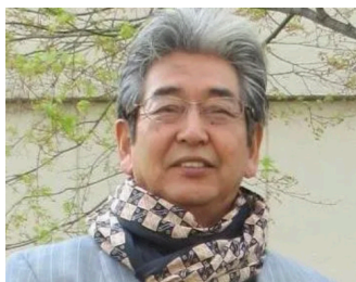
現代美術家 / 東京藝術大学名誉教授 保科 豊巳