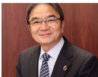
金工作家 / 東京藝術大学元学長 文化庁元長官 宮田 亮平