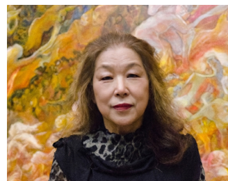
画家 / 武蔵野美術大学名誉教授 遠藤 彰子