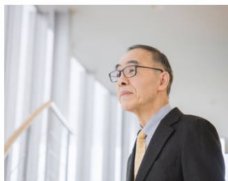
美術家 / 秋田公立美術大学学長 北郷 悟