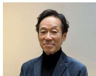
東京都美術館館長 高橋 明也